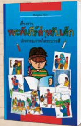
Verteilaktion Kindermalbibeln in Thailand

Albanisch, Arabisch, Chinesisch, Deutsch, Englisch, Französisch, Griechisch, Italienisch, Koreanisch, Niederländisch, Persisch/Farsi, Polnisch, Portugiesisch, Rumänisch, Russisch, Serbisch, Slowakisch, Spanisch, Suaheli, Thai, Türkisch, Ukrainisch, Ungarisch, Vietnamesisch